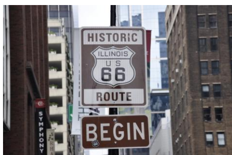
Début de la route 66

Vendredi 3 oct, nous allons prendre la route 66, à E.Adams entre S Michigan Ave et Wabash Ave. C'est ici que commence la mythique route 66.