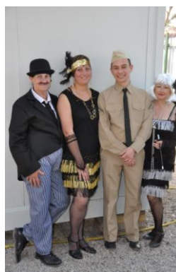
Une partie d'Oklahoma Country