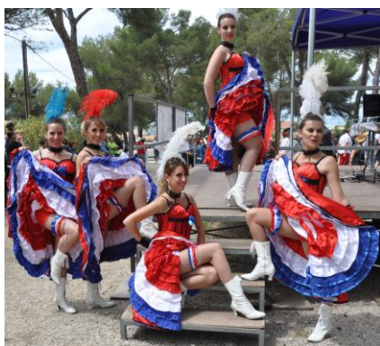
Les Cotton Girls