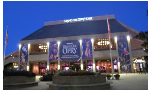
Devant le Grand Ole Opry 18h45

Une histoire qui commence au milieu des années 1920, avec l'émission radiophonique WSM Barn Dance, qui deviendra "The Grand Ole Opry", puis en 1942, avec la création de "Acuff Rose Music", la première société d'édition de musique country à Nashville.