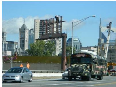
Arrivée à Nashville

La ville est connue pour son industrie musicale principalement orientée vers la country et le Bluegrass.