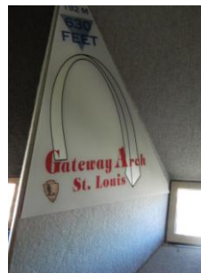
Hublot de vue au sommet

Nous nous retrouvons à 6 dans une cabine genre cosmonaute, il ne faut pas être claustrophobe.