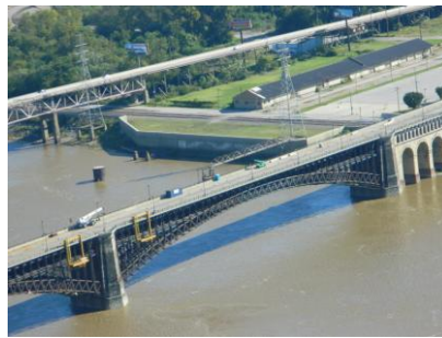
Vue sur le Mississippi