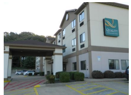
Hotel Quality Inn